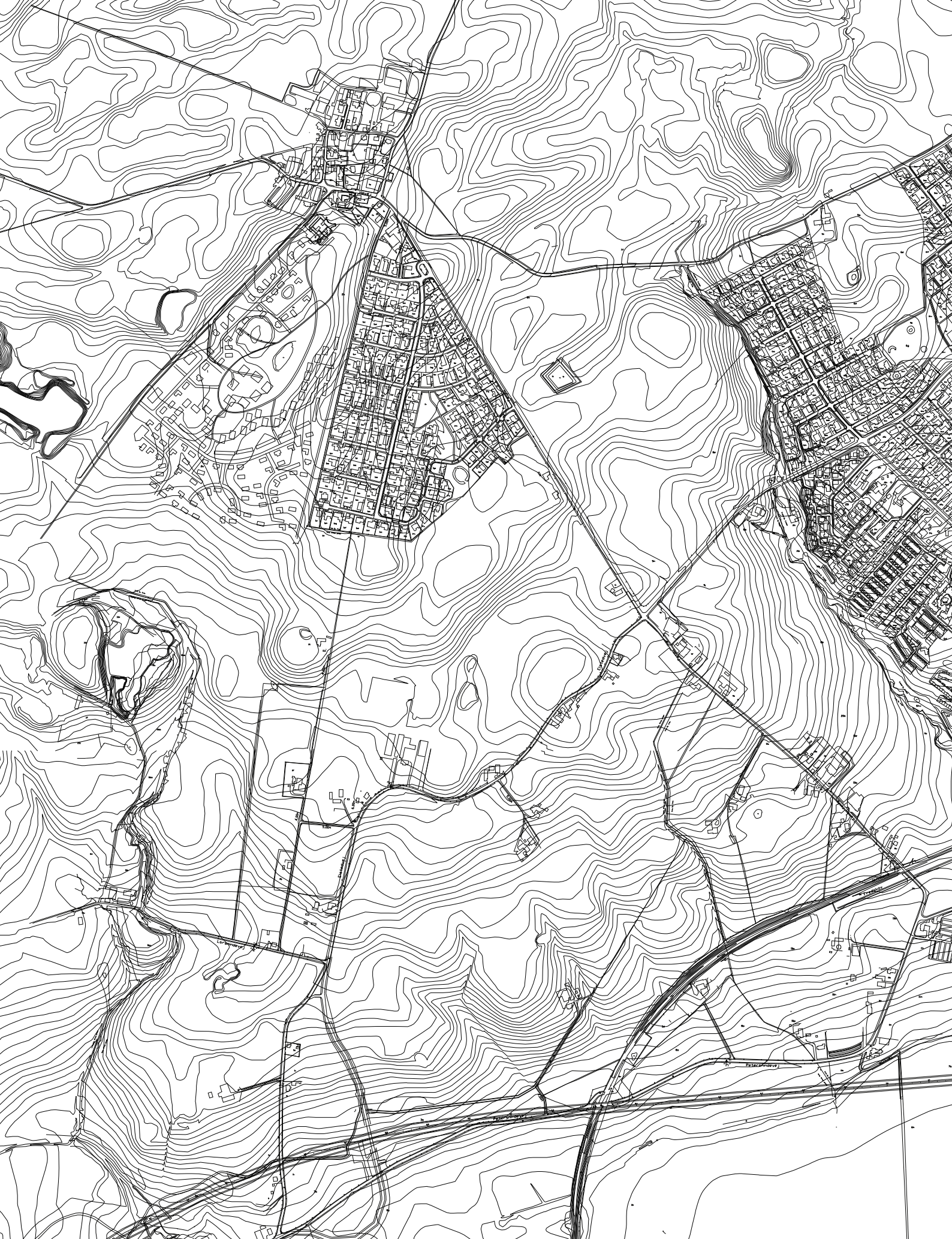
Helt perspektivarealet ligger på en sydvendt skræning, hvorfra der er en imponerende udsigt. Landskabet er præget af en varieret topografi med læhøgn og spredt beplantning.