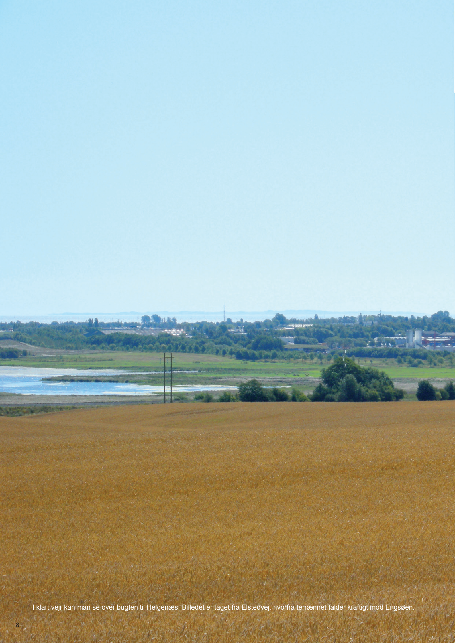
I klart vejr kan man se over bugten til Helgenæs. Billedet er taget fra Elstedvej, hvorfra terrænet falder kraftigt mod Engsøen.