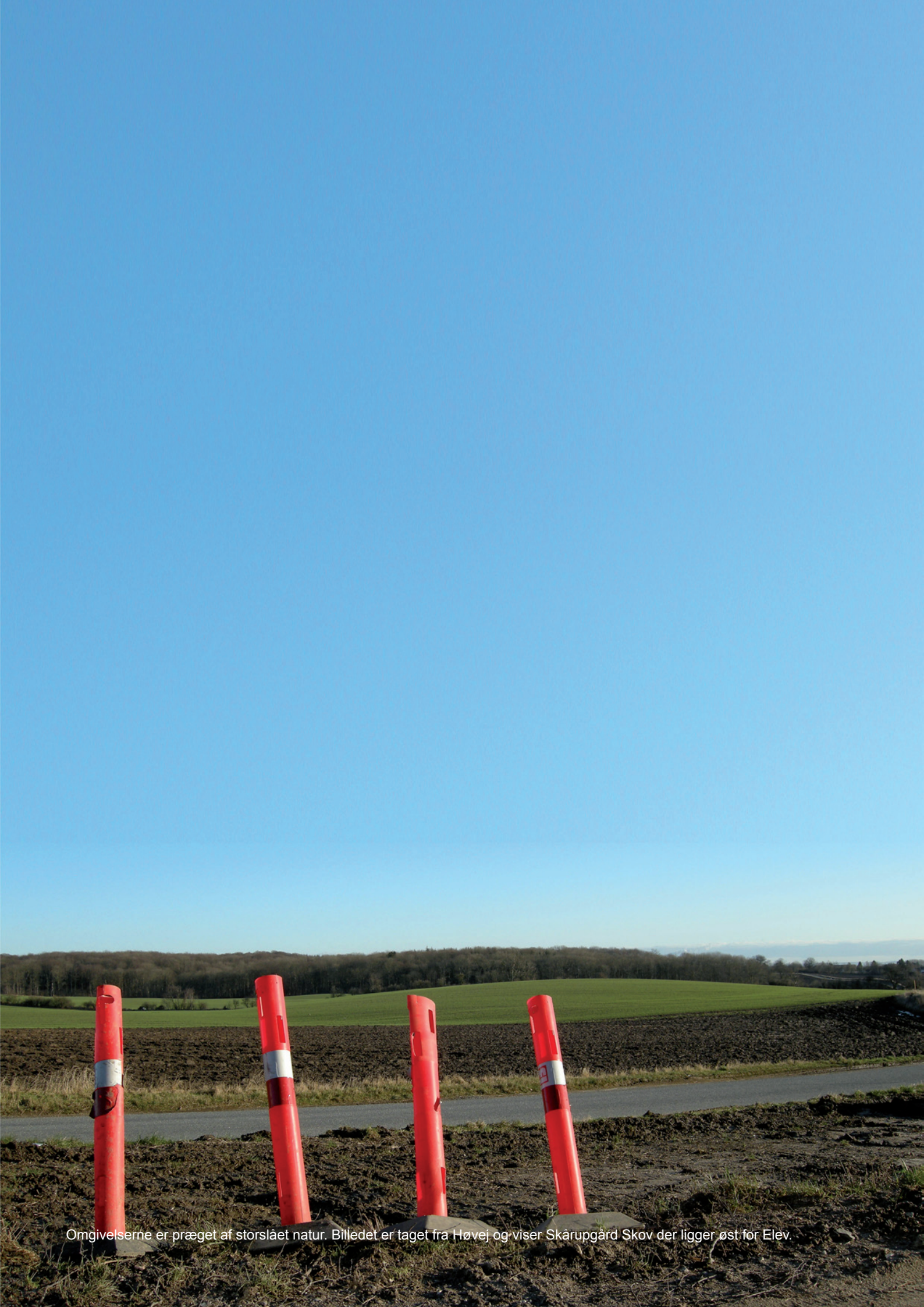
Omgivelserne er præget af storslået natur. Billedet er taget fra Høvej og viser Skårupgård Skov der ligger øst for Elev.