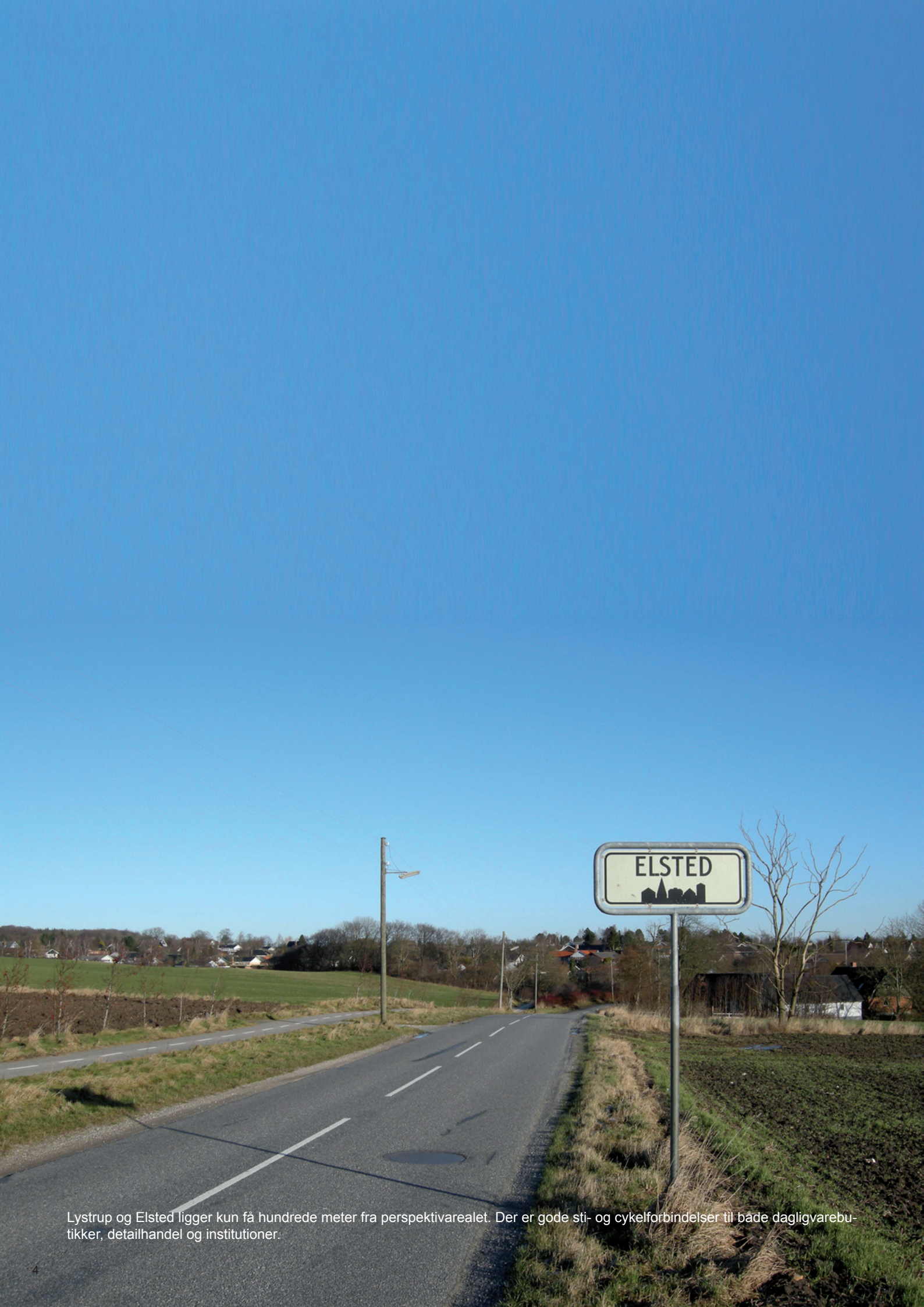
Lystrup og Elsted ligger kun få hundrede meter fra perspektivarealet. Der er gode sti- og cykelforbindelser til både dagligvarebutikker, detailhandel og institutioner.